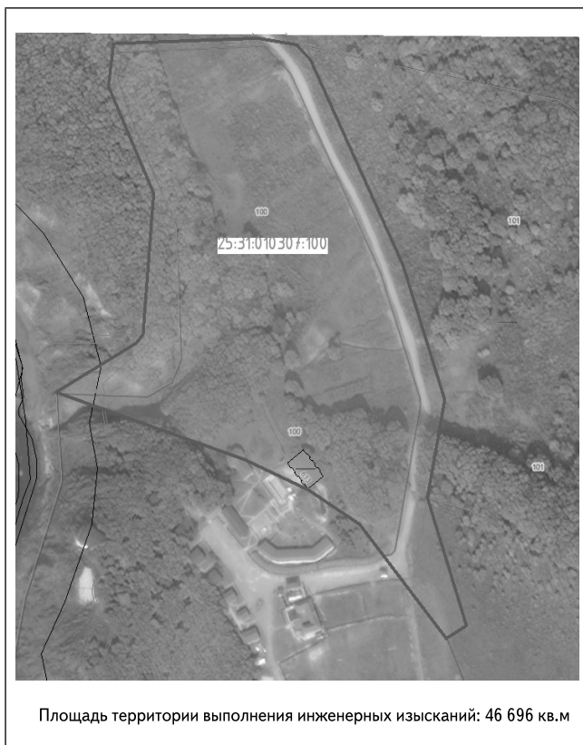
Площадь территории выполнения инженерных изысканий: 46 696 кв. м

Приложение к заданию на выполнение инженерных изысканий для подготовки документации по планировке территории, утвержденному постановлением администрации Находкинского городского округа