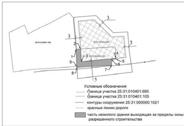
СХЕМА ГРАНИЦ отклонения от предельных параметров разрешенного строительства (реконструкции) объектов капитального строительства в границах земельного участка с кадастровым номером 25:31:010401:695

Кординаты контура ОКС, выходящего за границу зоны допустимого размещения зданий, сооружений: