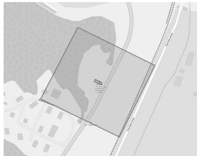
СХЕМА № 1 границ территории, прилегающей к «Памятник Победы в Великой Отечественной войне 1941-1945 гг.», во время проведения массового мероприятия в соответствии с п. 9, ч. 1 ст. 6 Закона Приморского края от 02.12.2009 № 536-КЗ.

УТВЕРЖДЕНА постановлением администрации Находкинского городского округа