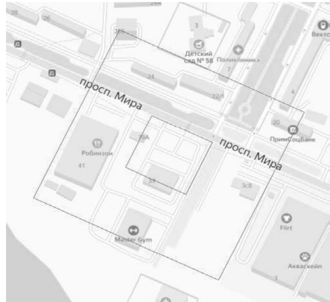
СХЕМА № 2 границ территории, прилегающей к площади муниципального автономного учреждения дополнительного образования «Спортивная школа «Приморец» Находкинского городского округа, расположенного по адресу г. Находка, Проспект Мира, 39, во время проведения массового мероприятия в соответствии с п. 9, ч. 1 ст. 6 Закона Приморского края от 02.12.2009 № 536-КЗ.

Администрация Находкинского городского округа Приморского края