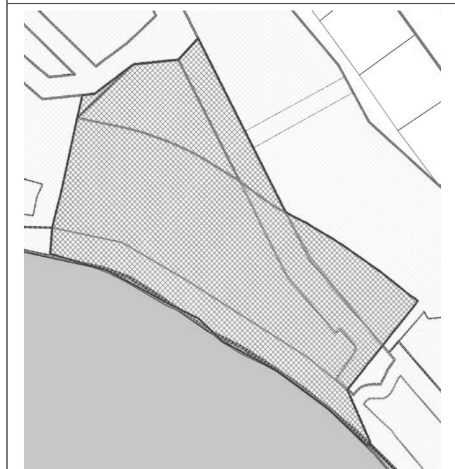
Схема границ территории для подготовки документации по внесению изменений в документацию по планировке территории, утвержденные постановлениями администрации Находкинского городского округа от 07.09.2010 № 1788, от 12.10.2012 № 1734, от 07.07.2016 № 752 «Об утверждении документации по планировке территории», в составе проекта планировки территории и проекта межевания территории, в части территории, ограниченной береговой полосой бухты Прогулочной, руслом ручья и границами водоразделов в городе Находке

Площадь территории в границах подготовки документации по внесению изменений в документацию по планировке территории: 33471,79 кв. м