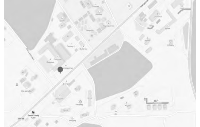
СХЕМА № 175

размещения нестационарного торгового объекта