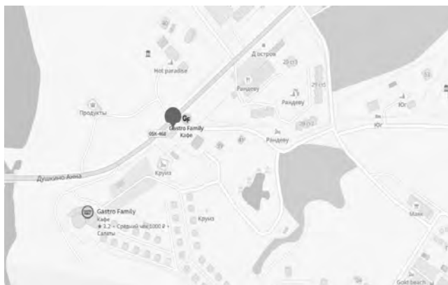
СХЕМА № 174

размещения нестационарного торгового объекта