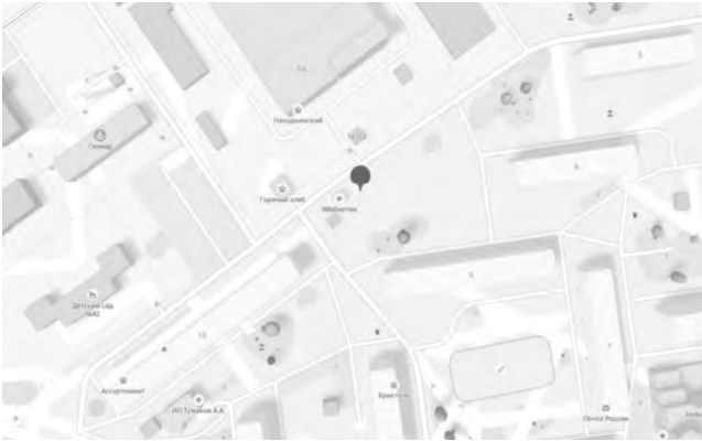
СХЕМА № 172

размещения нестационарного торгового объекта