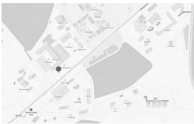
СХЕМА № 177

размещения нестационарного торгового объекта