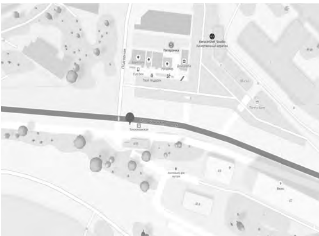
СХЕМА № 513 размещения нестационарного торгового объекта